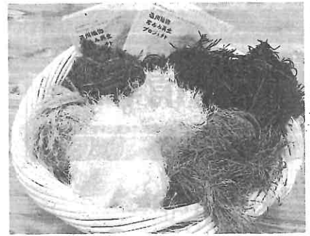
加盟社から回収した生地の耳