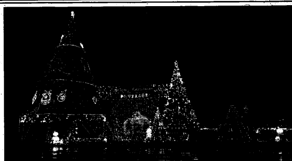
高さ15mと8mのヒマラヤスギにイルミネーション

寝具製造卸・小売りのイワタ(京都市)のマットレス「ラクオール」が、「産業と炭素排出を最小化する、サーキュラーデザインのマットレス」度微粒子セラミックス練り込みポリエステル機能繊維の光電子を活用した中わた材。多層構造の繊維中綿わたを使用することで、ソフトで高い断熱性・圧縮・復元性を実現した。環境にも配慮し、全体の90%以上リサイクルポリエステルを使用している。 社員製造卸・小売りのイワタ(京都市)のマットレス「ラクオール」が、「産業と炭素排出を最小化する、サーキュラーデザインのマットレス」度微粒子セラミックス練り込みポリエステル機能繊維の光電子を活用した中わた材。多層構造の繊維中綿わたを使用することで、ソフトで高い断熱性・圧縮・復元性を実現した。環境にも配慮し、全体の90%以上リサイクルポリエステルを使用している。